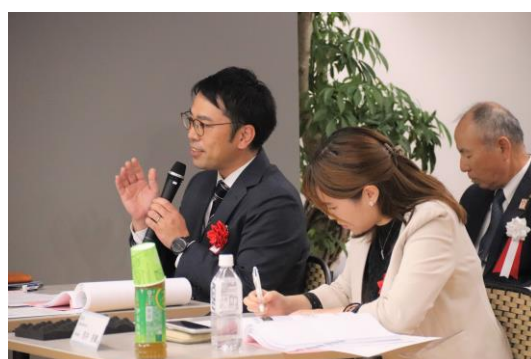
【日本政策金融公庫高上さまの質疑応答】