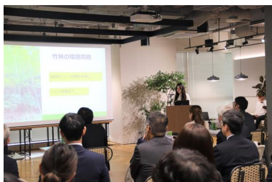
【優秀賞を受賞した岸さまの発表】