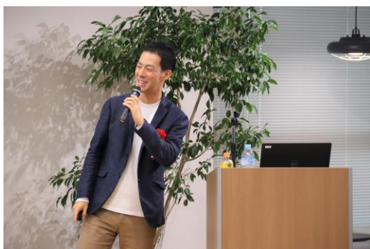
【株式会社Flucle三田さまの基調講演】