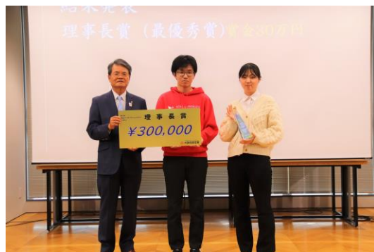
【最優秀賞（理事長賞）受賞】