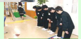
ロビーにて挨拶の練