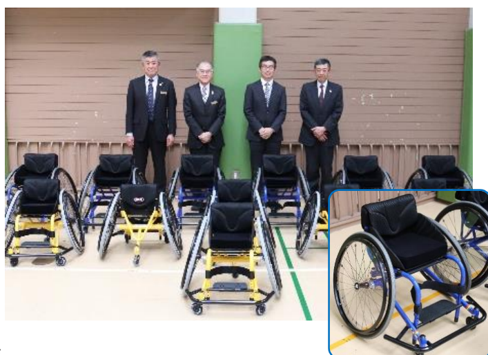
『WeeGo』競技用車いす12台 競技を選ばない新設計

《お問い合わせ先》 業務部CSR統括課 TEL :06-6775-6599 E-mail : csr@osaka-shinkin.co.jp