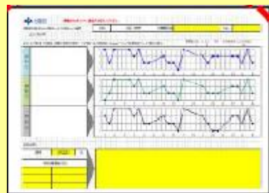
雇用管理ツールの例