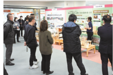
「おおさかATCエコプラザ」見学