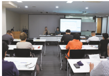
「中小企業版SBT認証」取得に向けて