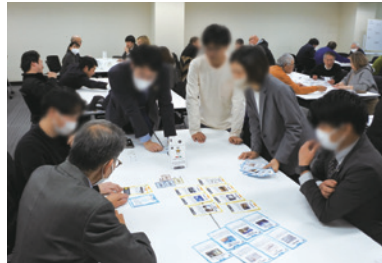
「ワークショップ」開催

さらに、おおさかATCエコプラザでは、「脱炭素経営で社会価値を企業価値に変える方法」についてのセミナーを開催後、同施設内にある環境ビジネスの先進事例を見学し、脱炭素への意識向上と普及活動を行っています。