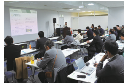
「おおさかATCエコプラザ」セミナー