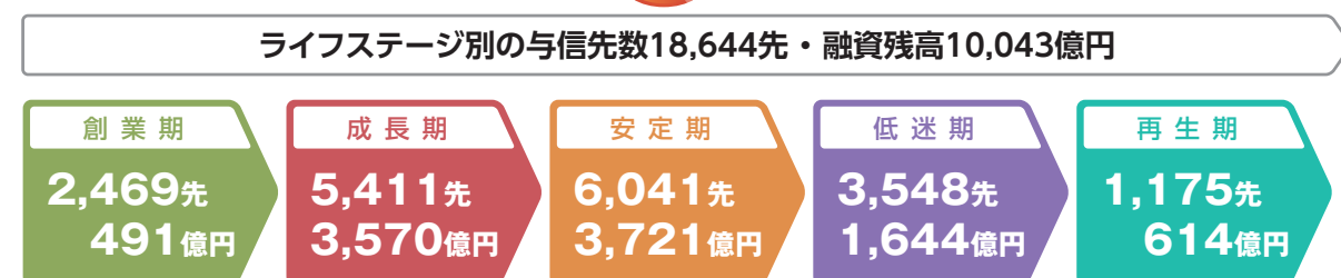
◎ライフステージ別の与信先数、および融資残高