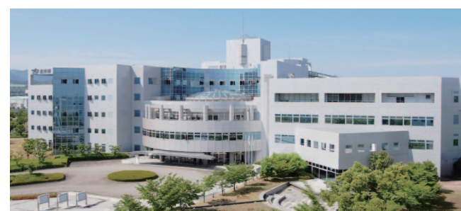
■ 「大阪技術研ラボツアー」開催の様子