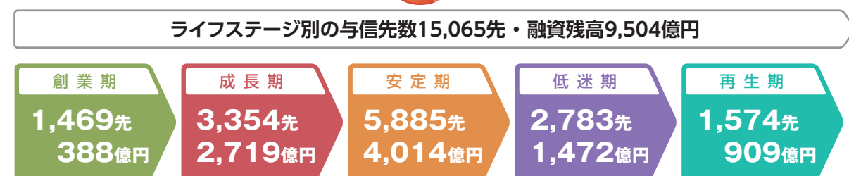
◎ライフステージ別の与信先数、および融資残高