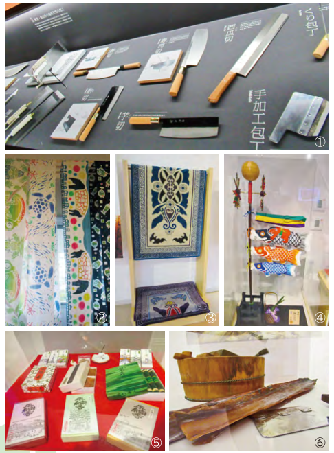
①堺刃物 ②注染 ③堺織通 ④堺五月鯉織 ⑤お香・線香 ⑥おぼろ昆布