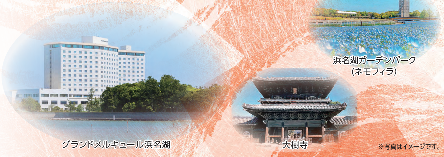
グランドメルキュール浜名湖