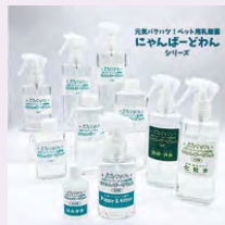
弊社製品【にゃんぱーどわん®】