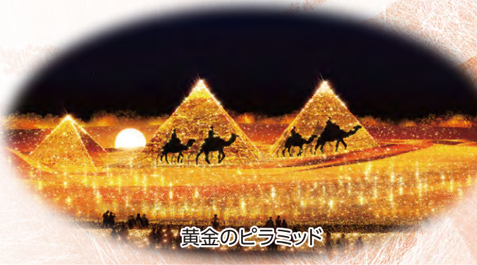
黄金のピラミッド