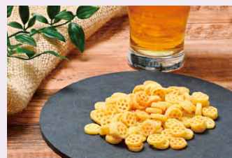
【弊社商品 パスタスナック】

今後、このラボツアーで得た知識を活かし、たゆまぬ努力を続けて参りますので、今後とも皆様のご愛顧の程よろしくお願いたします。