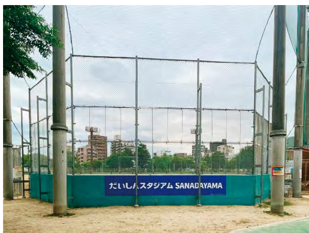
真田山野球場(真田山公園内)