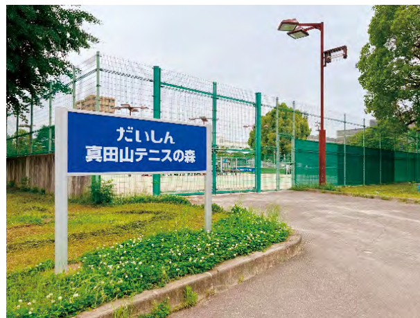
真田山庭球場(真田山公園内)