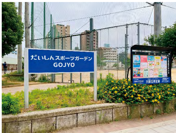
五条運動場(五条公園内)