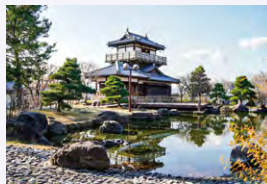
※写真はイメージです

この一帯を支配していた地方豪族・池田氏の居城跡地を整備した公園。園内のやぐら風展望休憩舎から池田市内を一望できます。日本庭園が美しく、6月には白百合が可憐に咲き誇ります。