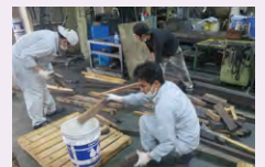
【現場カイゼンの様子】

今後、モノづくり現場に潜むムダを一つでも多く発見し、カイゼン案を検討、実施することによって、これまで以上のサービス提供に努めてまいります。