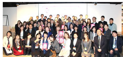
<ファイナリストと応援者>