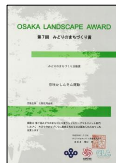
みどりのまちづくり活動賞