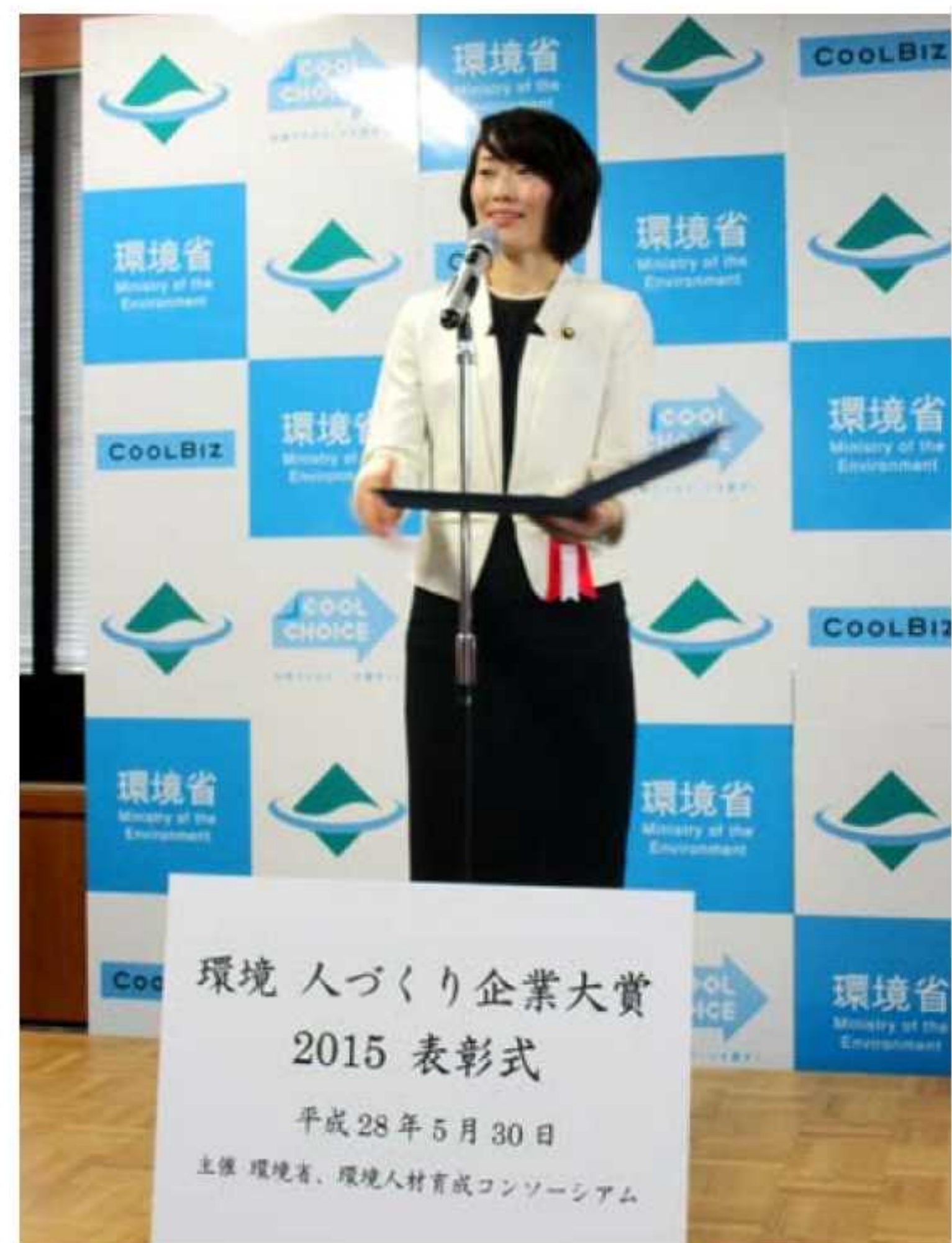
環境省 丸川 珠代 大臣